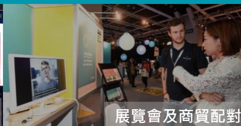
展覽會及商貿配對