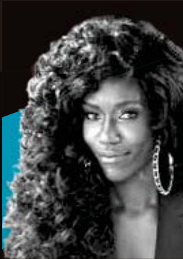
Bozoma Saint John