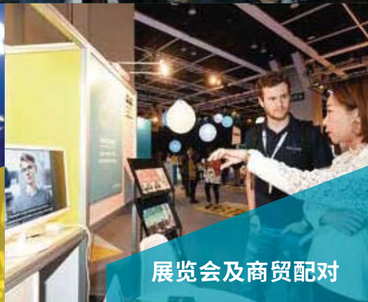
展览会及商贸配对